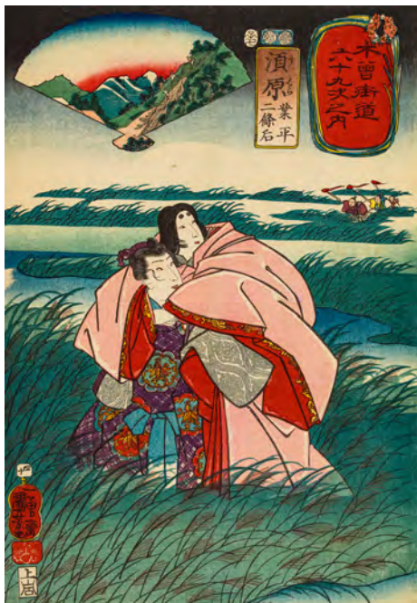
↑ Utagawa Kuniyoshi (1797–1861) Les Soixante-neuf Relais de la route du Kisokaidō Relais n°40. Suhara : Narihira et Dame Nijō 1852, 7 e mois Xylogravure polychrome, format ōban tate-e Paris, musée Cernuschi, M.C. 4780.40 Legs Henri Cernuschi, 1896

Le parcours sera enrichi d' outils de médiation et de dispositifs numériques pour permettre aux visiteurs d'appréhender l'art de la gravure et offrir une véritable immersion au cœur du Kisokaidō.