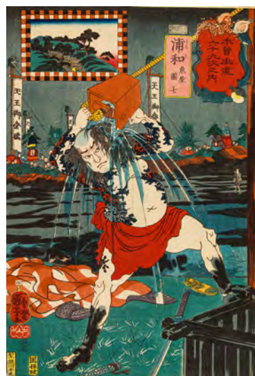
↑ Utagawa Kuniyoshi (1797–1861) Les Soixante-neuf Relais de la route du Kisokaidō Relais n°4. Urawa : Le poissonnier Danshichi 1852, 5 e mois Xylogravure polychrome, format ōban tate-e Paris, musée Cernuschi, M.C. 4780.04 Legs Henri Cernuschi, 1896

Enfin, une projection dans la quatrième salle du parcours présentera une sélection d'estampes de la très rare suite de Kunisada (1786-1865), provenant du Museum of Fine Arts de Boston . Ce dispositif accompagnant les deux ensembles de l'exposition permettra d'offrir encore davantage de contenus variés autour de la route du Kisokaidō.