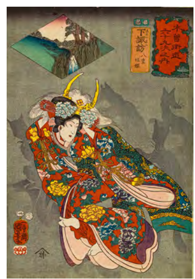
↑ Utagawa Kuniyoshi (1797–1861) Les Soixante-neuf Relais de la route du Kisokaidō Relais n°30. Shimosuwa : Yaegaki hime 1852, 8 e mois Xylogravure polychrome, format ōban tate-e Paris, musée Cernuschi, M.C. 4780.30 Legs Henri Cernuschi, 1896