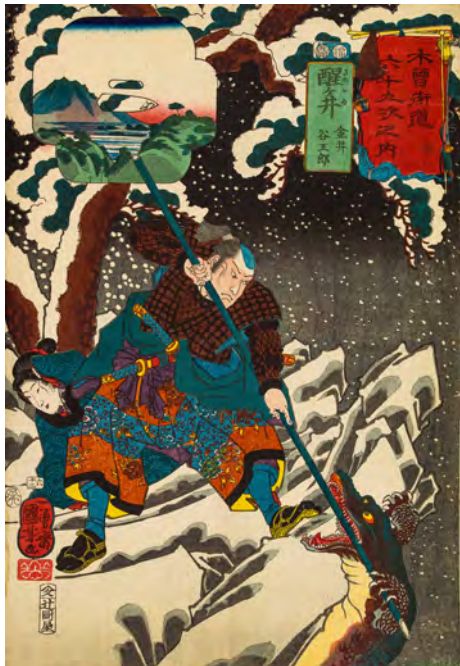
↑ Utagawa Kuniyoshi (1797–1861) Les Soixante-neuf Relais de la route du Kisokaidō Relais n°62. Samegai : Kanai Tanigorō 1852, 6 e mois Xylogravure polychrome, format ōban tate-e Paris, musée Cernuschi, M.C. 4780.62 Legs Henri Cernuschi, 1896