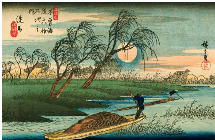
↑ Utagawa Hiroshige (1797-1858) Les Soixante-neuf Relais de la route du Kisokaidō Relais n°32. Seba 1835-1838 Xylogravure polychrome, format ōban yoko-e