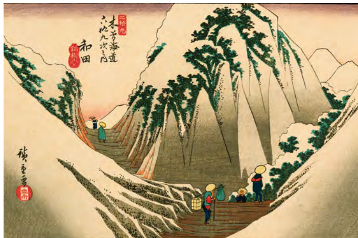
↑ Utagawa Hiroshige (1797-1858) Les Soixante-neuf Relais de la route du Kisokaidō Relais n°29. Wada 1835-1838 Xylogravure polychrome, format ōban yoko-e