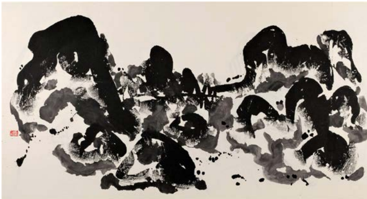
Ma Desheng (né en 1952) Sans titre , 1991 Encre sur papier 121 x 198 cm M.C. 2013-12 Don de l'artiste, 2013 © Paris Musées / Musée Cernuschi © Ma Desheng

Principaux artistes : Ma Desheng, Li Huasheng, Li Jin, Yang Jiechang