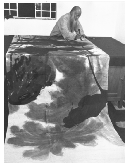
Chang Dai-chien (Zhang Daqian) traçant les feuilles de lotus de l'avant-dernier panneau de gauche ( Les Lotus Géants , 1961)