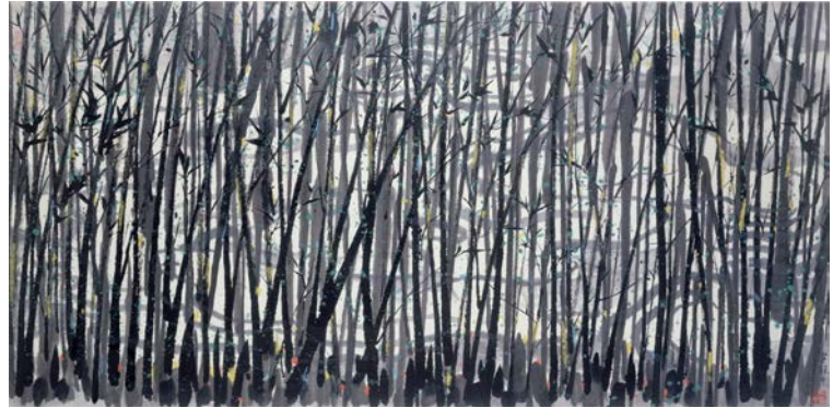
Wu Guanzhong (1919-2010) Forêt de bambous et champs irrigués, 1992 Encre et couleurs sur papier 67,8 x 137 cm M.C. 9911 Don de l'artiste, 1993