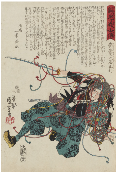
Utawaga Kuniyoshi (1797-1861), Histoires de la véritable loyauté des fidèles samourais, Seichū gishi den (n°33), 1847-1848. Xylogravure polychrome. 36,8 x 26,8 cm. M.C. 4777. Legs Henri Cernuschi, 1896.

Cette exposition associe également aux oeuvres issues du legs Tavernier des albums d'estampes , très rarement exposés en raison de leur fragilité, provenant de la collection d'Henri Cernuschi . L'ensemble présenté permet d' explorer des sous-genres de l'ukiyo-e tels que les images de belles femmes ( bijin-ga ), les caricatures ( giga ) ou les scènes inspirées du Dit du Genji ( genji-e ), célèbre roman du XI e siècle contant les intrigues amoureuses et politiques du Prince Genji, revisité à l'époque d'Edo par Ryūtei Tanehiko (1783-1842).