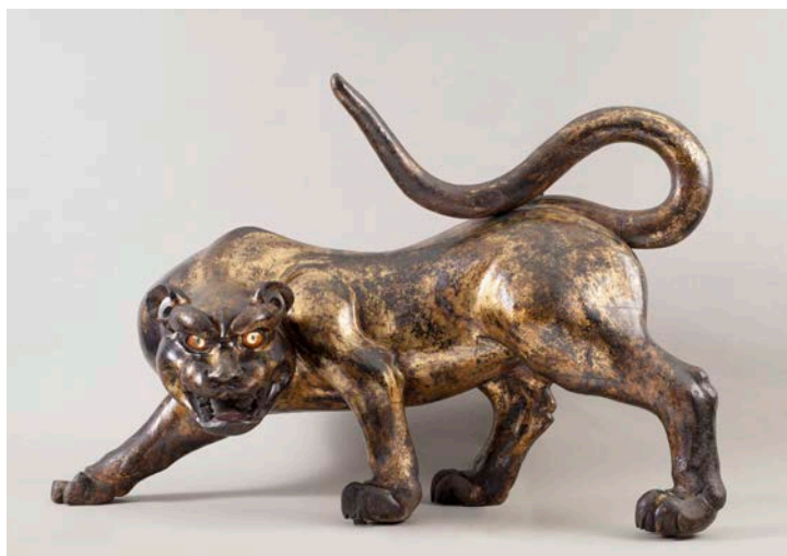
↑ Tigre dit « tora », bois laqué et doré, yeux incrustés, XVIII-XIX e siècle, Paris, Musée Cernuschi. Ancienne collection Henri Cernuschi.

Le musée des Arts de l'Asie de la Ville de Paris est né de la volonté d'Henri Cernuschi (1821-1896), son fondateur. Familier de Léon Gambetta, d'Émile Zola, aussi bien que de Sarah Bernhardt ou d'Edmond de Goncourt, Cernuschi est une figure marquante du Paris intellectuel et artistique de la fin du XIX e siècle. Homme politique d'origine italienne aux engagements républicains, économiste et financier célèbre pour ses théories monétaires, Henri Cernuschi est aujourd'hui principalement connu à travers le prisme des arts asiatiques.