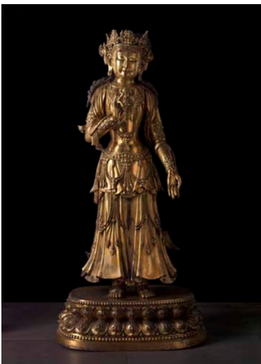
↑ Bodhisattva, Dynastie Ming (1368-1644), Règne de Yongle (1403-1424), Bronze doré, M.C. 5173. Legs Pauline Tarn, dite Renée Vivien, 1909.