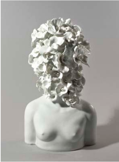
↑ Ru Xiaofan, Jeunesse , porcelaine blanche, 2012, Paris, Musée Cernuschi.

Ouvert au public en 1898, le musée Cernuschi devient rapidement le théâtre d'expositions principalement consacrées aux arts de la Chine et du Japon. Pendant la première moitié du XX e siècle, les importantes découvertes archéologiques en Chine et au Vietnam impulsent une nouvelle orientation au musée, désormais largement consacré aux origines des cultures d'Asie orientale.