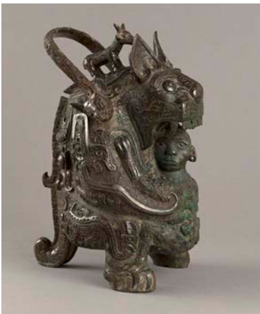
↑ Vase you dit « la Tigresse ». Époque Shang (vers 1600 – vers 1050 av. J.-C.), XI e siècle av. J.-C., Bronze, M.C. 6155