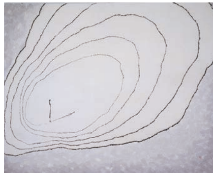
↑ Shim Kyung-Ja (née en 1944), Karma, 179x219 cm, encre et couleurs sur papier, 1998. Don de l'artiste, M.C. 2016-43.

À l'occasion de ces travaux une importante campagne de restauration des collections a été réalisée par le musée notamment grâce au soutien d'un financement participatif pour la restauration des céramiques archéologiques vietnamiennes.