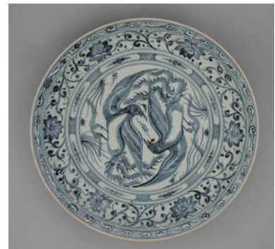
↑ Grand plat aux phénix. Dynastie des Lè postérieurs (1428 – 1788). Grès à décor bleu-et-blanc sous couverte, M.C. 2016-57