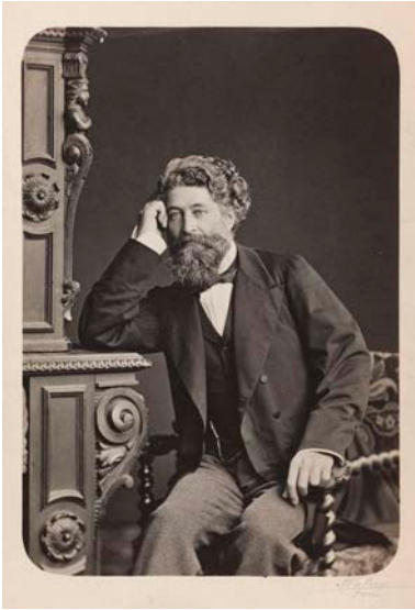
↑ Portrait d'Henri Cernuschi, 1876,