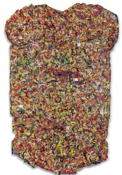
Shin Sung Hy, Espace de structure , 1989, acrylique sur carton, fonds d'atelier Shin Sung Hy.