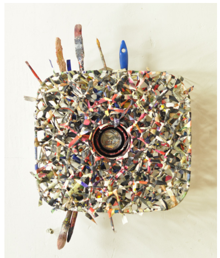
Shin Sung Hy, Autoportrait , 2004, acrylique sur toile, pinceaux, miroir et cadre, fonds d'atelier Shin Sung Hy.