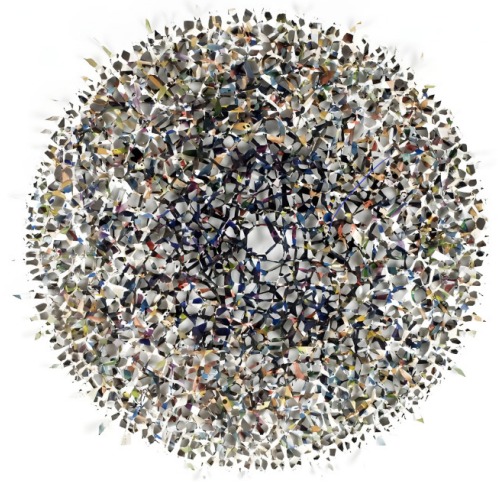
Shin Sung Hy, Peinture spatiale , 2008, acrylique sur toile, fonds d'atelier Shin Sung Hy.

Mael Bellec, conservateur en chef, responsable des collections chinoises et coréennes du musée Cernuschi.