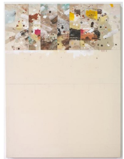
Shin Sung Hy, Solution de continuité , 1994, acrylique sur toile, fonds d'atelier Shin Sung Hy.