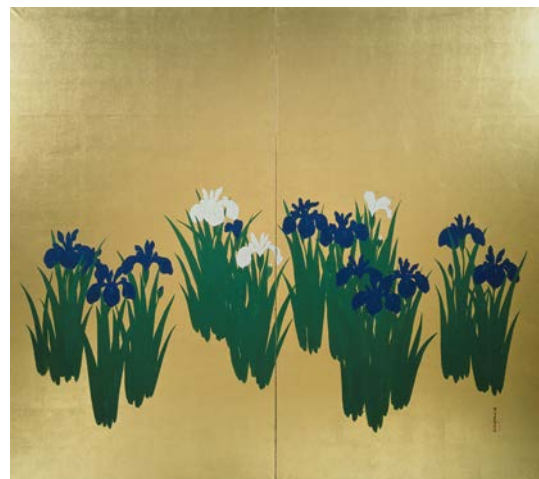
Kamisaka Sekka, Iris , 1920-40, paire de paravents à deux panneaux, encre et couleurs sur feuille d'or, collection particulière, Kyôto