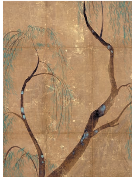
Ogata Kōrin, Papier pour envelopper l'encens avec décor de saules pleureurs, 1704-11, couleurs sur fond de feuille d'or sur papier recouvert de soie, musée Hosomi, Kyōto

Le goût développé par Kōetsu et Sōtatsu évolue grâce au style souple et élégant de Kōrin reconnaissable par ses créations épurées à la composition audacieuse, sa gamme chromatique intense et son rythme harmonieux. Connu et apprécié en France à l'époque du japonisme, Kōrin était considéré par les amateurs parisiens comme le plus original des peintres de l'archipel, le plus Japonais des Japonais.