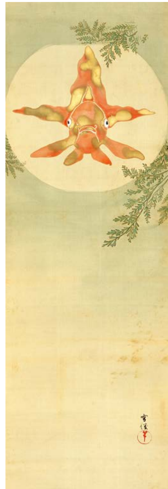
Kamisaka Sekka, Le bocal au poisson rouge , 1905-15, rouleau vertical, encre et couleurs sur soie, musée Hosomi, Kyôto

Ici, la diversité des œuvres présentées montrera les multiples facettes de cet artiste formidable considéré comme l'héritier du style Rinpa au XX e siècle. Les albums illustrés qui ont rendu célèbre l'artiste sont associés aux peintures les plus représentatives de son style.