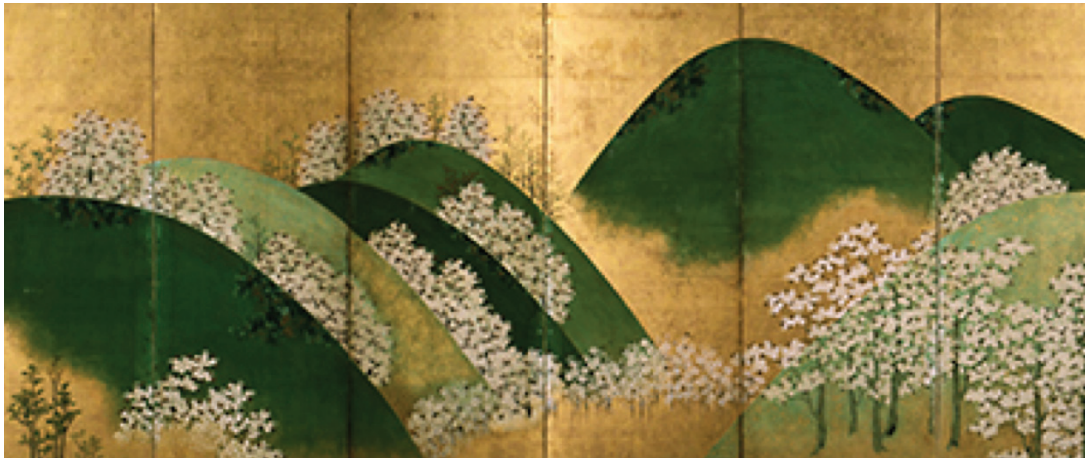
Watanabe Shikō, Cerisiers en fleurs à Yoshino , paravent gauche, XVIII e siècle, paire de paravents à six panneaux, encre et couleurs sur feuille d'or

Dans cette section, les successeurs de Kōrin, inspirés par son style, portent au sommet la manière décorative Rinpa en revisitant les thèmes traditionnels avec délicatesse et simplification graphique. Ils représentent les éléments de la nature sur des fonds dorés, notamment la beauté des paysages transformés par le changement des saisons.