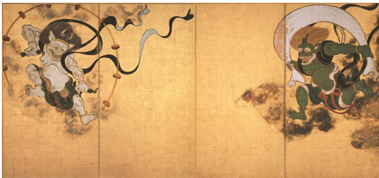
Tawaraya Sōtatsu, Dieux du vent et du tonnerre , XVII e siècle, paire de paravents à deux panneaux, encre et couleurs sur feuille d'or, Kyoto, Kennin-ji, Œuvre classée au Japon « Trésor national »

Le musée Cernuschi présente du 26 octobre au 27 janvier 2019, l'exposition Trésors de Kyoto, trois siècles de création Rinpa , qui dévoile pour la première fois hors du Japon des chefs-d'œuvre inestimables. Cette présentation proposée dans le cadre de la saison Japonismes 2018 : les âmes en résonances , offre l'opportunité exceptionnelle de découvrir durant les quatre premières semaines de l'exposition le Trésor National Dieux du vent et du tonnerre de Sōtatsu conservé dans le temple Kennin-ji à Kyoto et seulement visible en de très rares occasions.