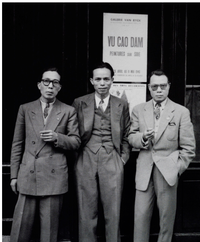
Vu Cao Dam entouré de Mai-Thu et Lê Phô lors de son exposition de peintures sur soie à la galerie Van Ryck. Paris, 1946.

VERNISSAGE PRESSE : VENDREDI 11 OCTOBRE DE 9H30 À 13H