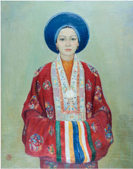
Mai-Thu, La Mariée . Huê, 1935. Huile sur toile Collection particulière © Comité Mai-Thu, ADAGP, Paris, [2024]