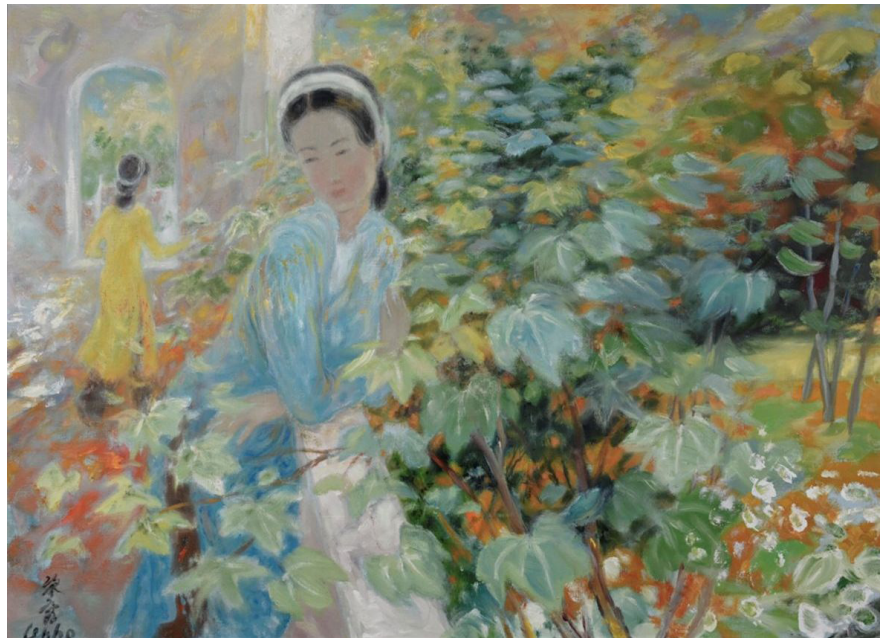
Lê Phô, Femmes au jardin . Paris, 1969. Huile sur toile. Collection particulière © Adagp, Paris, [2024]

La dernière période de Lê Phô est marquée par un style postimpressionniste coloré où les effets de lumière sont les seuls véritables sujets. Quant à Vu Cao Dam, son admiration pour Chagall dont il était voisin à Saint-Paul-de-Vence, éclate dans sa dernière période.