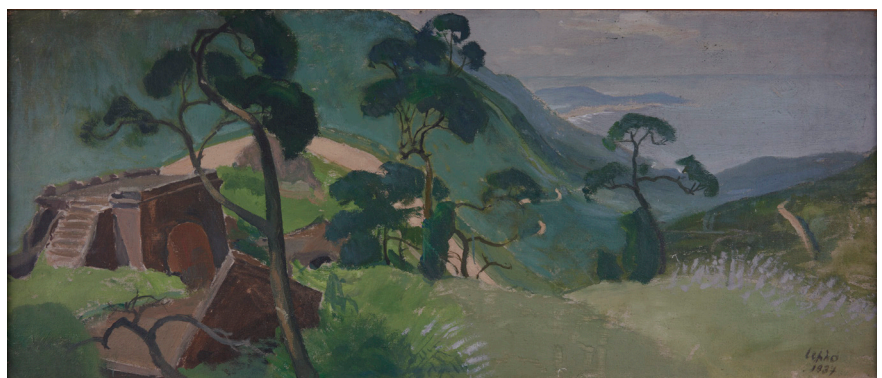
Lê Phô, Le Col des Nuages, [Đèo Hải Vân]. Vietnam, entre Huê et Danang, 1937. Huile sur toile. Collection particulière

À l'été 1946, Hồ Chí Minh se rend à Paris à l'occasion de la conférence de Fontainebleau. Les mouvements indépendantistes vietnamiens ont profité de l'affaiblissement de la France pendant la Seconde Guerre mondiale et, le 2 septembre 1945, la République démocratique du Vietnam est proclamée. Son président, Hồ Chí Minh, doit maintenant négocier les termes de l'indépendance. Il veut convaincre l'opinion française de la légitimité de ses demandes. C'est dans ce cadre qu'il rencontre les Vietnamiens de France, et parmi eux, Lê Phô, Mai-Thu et Vu Cao Dam. Ce dernier reçoit l'autorisation de faire le portrait en buste du président, quant à Mai-Thu, il réalise un film retraçant le séjour de Hồ Chí Minh en France.