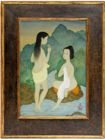
Mai-Thu, La Source . Vanves, 1966. Couleurs sur soie Collection Almine et Bernard Ruiz Picasso © Comité Mai-Thu, Adagp, Paris, [2024] / photo Ana Drittanti