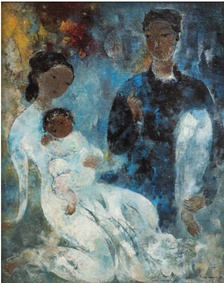
Vu Cao Dam, Famille . Vence, 1957. Huile sur panneau Collection Michel Vu © Adagp, Paris, [2024] / photo Michel Graniou