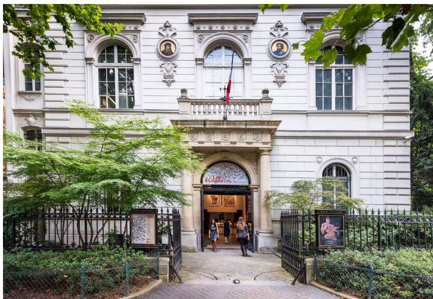
Musée Cernuschi

Depuis son ouverture au public en 1898, le musée Cernuschi, musée des arts de l'Asie de la Ville de Paris, a réuni près de 15 000 objets chinois, coréens, japonais et vietnamiens. Véritable invitation au voyage dans l'écrin de l'hôtel particulier imaginé au XIX e siècle par Henri Cernuschi, le parcours de visite des collections permanentes, rénové en 2020, présente un panorama repensé et enrichi de 5 000 ans d'art de l'Asie.