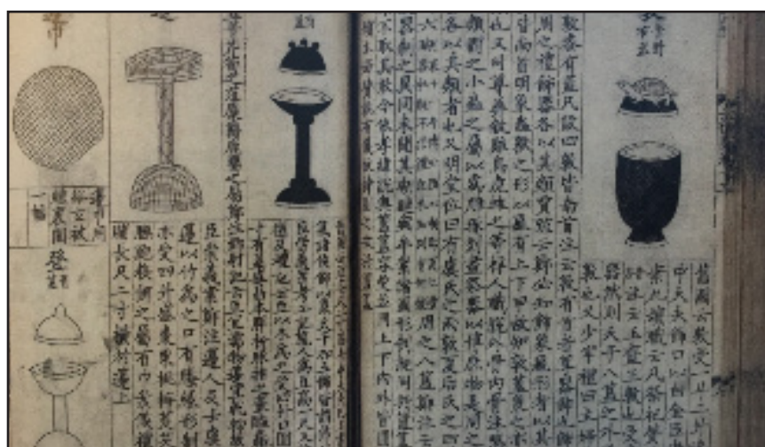
San li tu 三礼图 ou Traité illustré des trois rituels

Le papier est, depuis son invention, un support privilégié de l'écriture en Chine. L'œuvre de Shen Yinmo 沈尹默 s'inspire d'un modèle de Wang Xizhi 王羲之, actif au IV e siècle. Il réinterprète ainsi l'œuvre originale qui était présentée dans un format horizontal. L'auteur, originaire du Zhejiang 浙江, avait également suivi une formation au Japon (1903-1906). Devenu enseignant en littérature, il pratiquait une calligraphie empreinte d'un certain classicisme. Le sceau de l'auteur, en rouge, se détache clairement dans la partie gauche de la composition, sous sa signature.