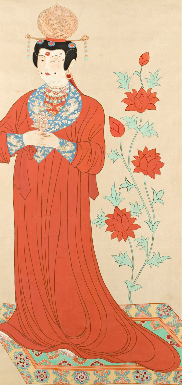
La Dame Li en donatrice tenant un brûle-parfum, Zhang Daqian 张大千, copie d'une peinture murale du X e siècle, vers 1943, encre et couleurs sur soie, H. 227,4 cm L. 88,8 cm, 1953, Chine, M.C. 8714