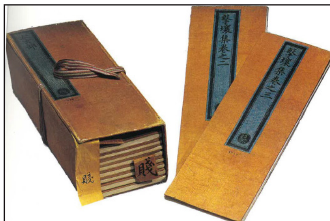
Ecole française d'Extrême-Orient, 1901; Bibliothèque Nationale, 1904

Les chinois ont inventé un système d'imprimerie sur plaque gravée dès le VI e siècle de notre ère. En lien avec la tradition manuscrite, on prit l'habitude de n'imprimer qu'une seule face de la feuille de papier. Tout d'abord, on édite des ouvrages assemblés avec de la colle, puis à partir du XV e siècle apparaissent les couvertures cousues.